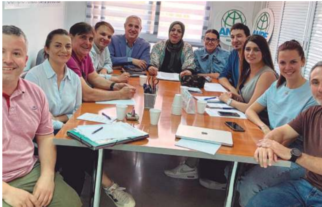
Imagen del encuentro mantenido este jueves.